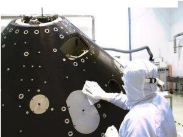
Contrôle du fardeau biologique d'ExoMars 2016 30 janvier 2014

Alors que les astronautes rêvent peut être de découvrir une forme de vie inconnue lors de leur carrière, le chargé de protection planétaire supervise des activités qui atteignent régulièrement cet objectif.